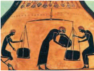
Εικόνα από αγγείο του 6ου αιώνα π.Χ. (Νέα Υόρκη, Μητροπολιτικό Μουσείο).